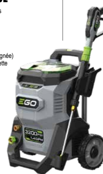
UN NETTOYEUR HAUTE PRESSION HPW2000E