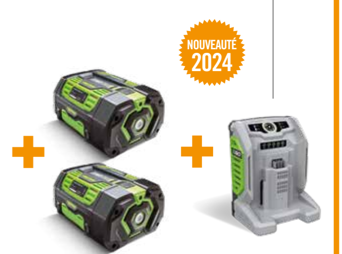
DEUX BATTERIES 7,5 AH BA4200T